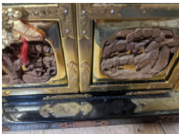
お修理前プレビュー