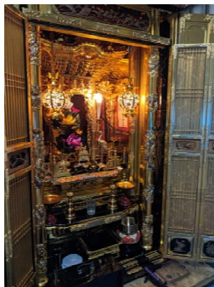
お修理後プレビュー